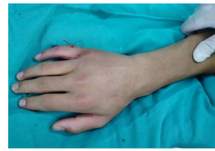
▲术后右手仅留两个针眼

近日,我院小儿外科病区成功为一名右手掌骨骨折的15岁体校男生实施闭合复位内固定手术,术后仅留两个针眼,拔针后即可自然愈合。目前,患者已出院居家康复。