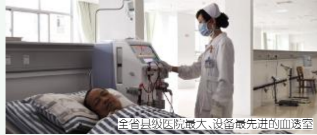
全省县级医院最大、设备最先进的血透室

自从搬到新院,院领导更加严格要求护理人员微笑服务,“您微笑了吗?”这样的标语在每个科室护士站都可以清楚的看到!每当听到他人对新院的赞美时,我心中的总有一种情怀油然而生,也许,这就是所谓的“沐医情怀!” (黄海月)