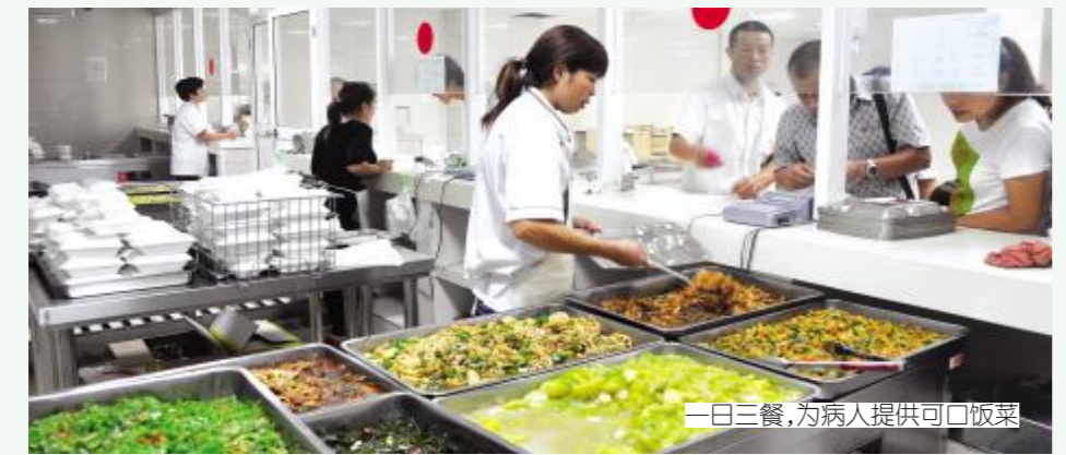
一日三餐,为病人提供可口饭菜

人性化精心管理。医院领导重视宣传工作,着力宣传医院学科建设以及在医疗、科研中取得的重要进展和重大成果。院内公开表彰先进典型,为医院树立良好的形象,激励全院职工努力工作。院领导关心职工冷暖,职工生病问候到病床;举办各种文体活动,把团队精神带到工作中。在充满人文关怀的管理环境下,全院职工情绪高昂,为创建三级医院、医学院附属医院而努力奋斗。 (蒋伯刚)