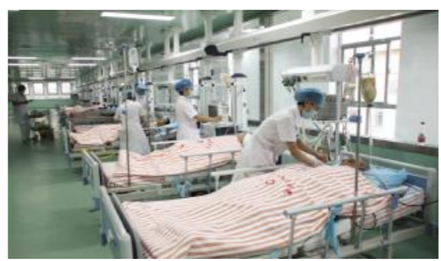
县级医院最大、条件最好的重症监护室。