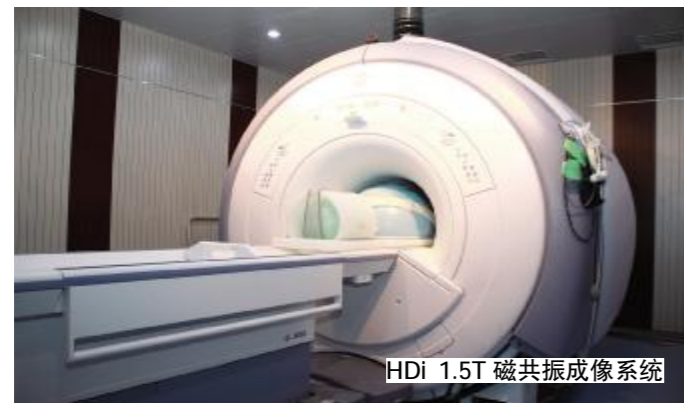
HDI 1.5T 磁共振成像系统

沭阳县人民医院引进 GE 公司最新 HDI 1.5T 磁共振成像系统,采用全新的 ISO 成像技术,实现了在提高扫描速度的同时,还能提高扫描范围、信噪比和分辨率,并且有效地克服运动伪影和干扰,极大地扩展了