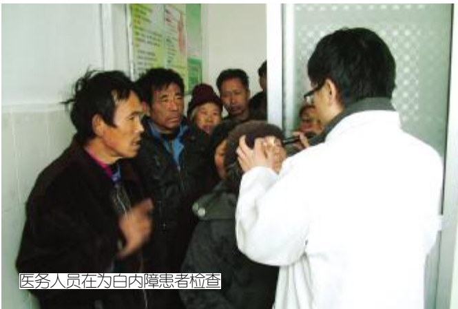
医务人员在为白内障患者筛查