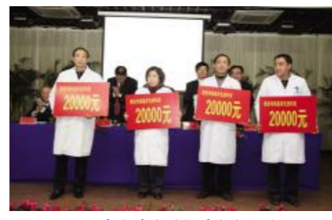
院领导为科技创新科室发大奖