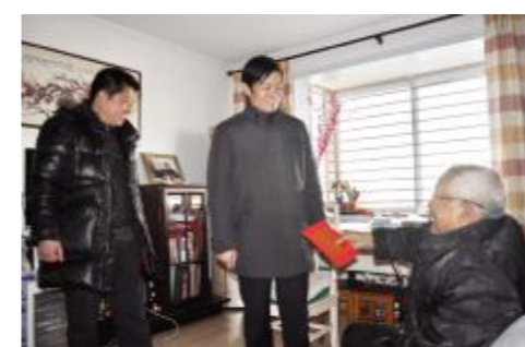
院领导慰问离休干部