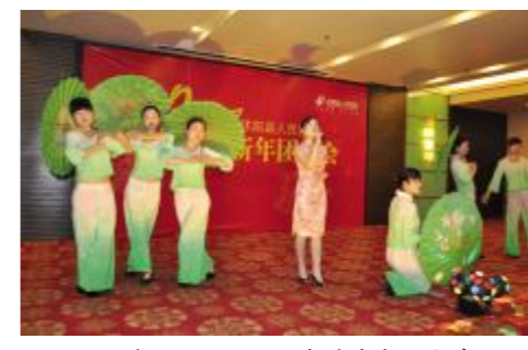
团拜会上，医院职工载歌载舞迎新春